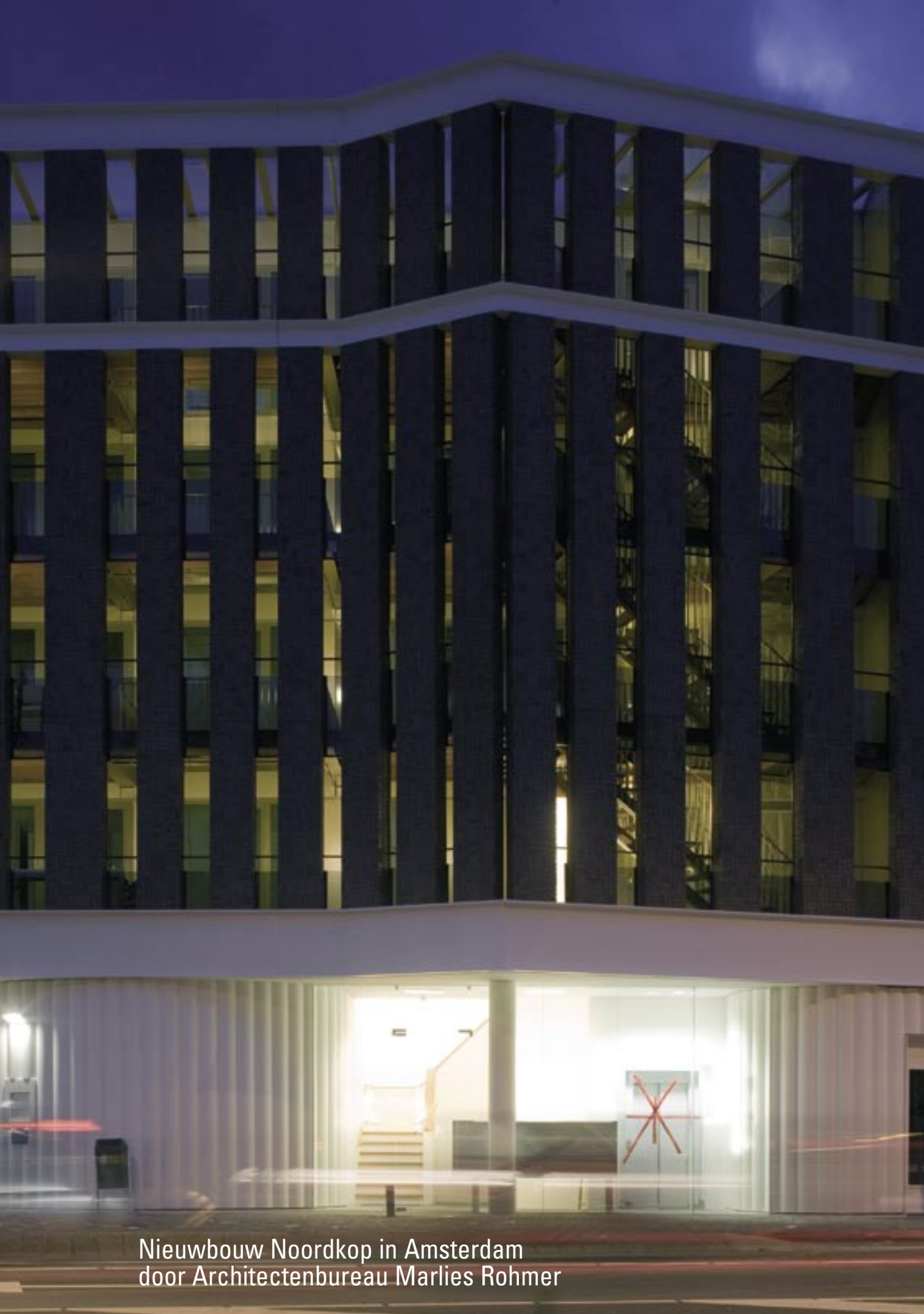
Nieuwbouw Noordkop in Amsterdam door Architectenbureau Marlies Rohmer